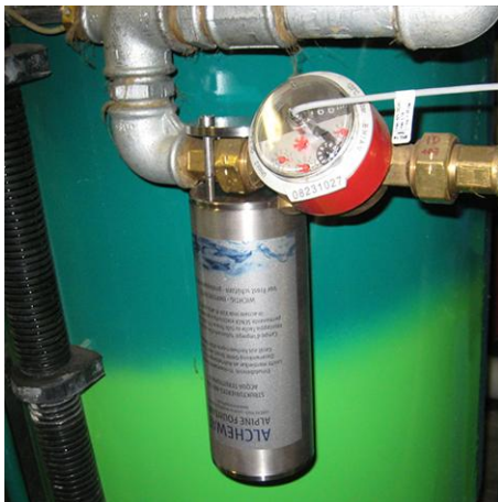
Kälteanlage Büros und Handwerksbetriebe