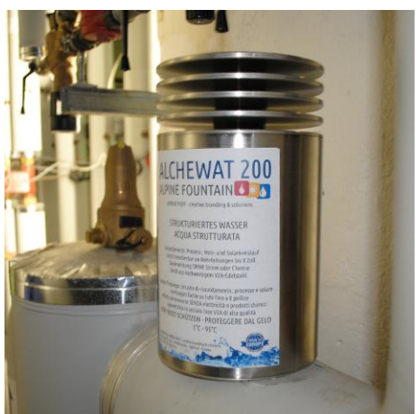
48 Büros und Wohnungen